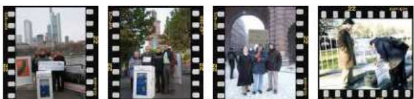
Frankfurt, Germany Frankfurt (Nov. 6. 11) Stockholm, Sweden Sofia, Bulgaria

Das unterschiedliche Medienecho in verschiedenen Ländern ist ein Beleg für die Synergien, die durch internationale Kooperation entstehen können. In Deutschland – abgesehen von einer kurzen Erwähnung in der FAZ – wurde allenfalls im Lokalteil berichtet, obwohl hier der Schwerpunkt der Aktivitäten lag. In