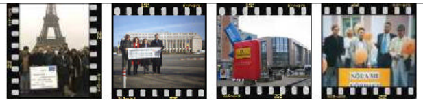
Paris, France Bucharest, Romania Brussels, (Dec. 12/13) Tallinn, Estonia

anderen Ländern kamen wir in der Primetime ins Fernsehen. In Luxemburg war das DI-Logo Hintergrund bei der Ansage eines Berichts in den Hauptnachrichten, in der Slowakei kamen wir in die Rotation eines Nachrichtensenders. Der EUobserver kündigte den Aktionstag mit einer eigenen Meldung an.